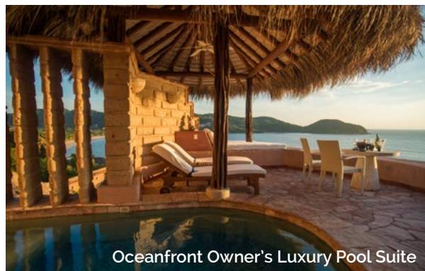
Oceanfront Owner's Luxury Pool Suite