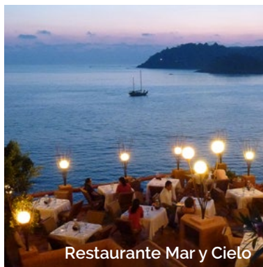
Restaurante Mar y Cielo

Restaurante Mar y Cielo Restaurante de verano Bar luz de Luna Spa by Clarins Alberca de agua de mar Alberca infinita Jacuzzi Boutique exclusiva Centro de acondicionamiento físico Sala de juntas Elevador de acceso al restaurante